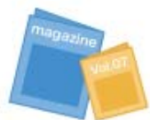
雑誌・カタログ等 定期購読物

写真、雑誌、文庫本、カタログ、パンフレット、商品サンプル、会報誌書類（信書を除く、再生可能なもの）